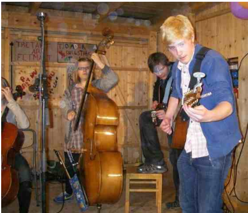
GUFs kompsektion öser på

Vid årets upplaga av spelmansstämman i Hovra den 3:e maj var många Gästrikar på plats. Flera av deltagarna i Låtstugan i Gävle hade passat på att gå på kurs hela långhelgen. Andra anslöt till stämman på lördagen. Stämman är mycket välordnad med flera dansbanor, konsertlokal och stora tält att spela, umgås och äta i. Vädret brukar också få godkänt, vad sägs om en solig eftermiddag och uppehållsväder hela natten? Musik och dans har huvudrollen. Hälsinge Låtverkstad visade sina talanger och GUF hade en bejublade dansspelning. Kursdeltagarna bjöd på sina nya kunskaper i fiolspel, ensemble, dans, sång och spel till dans. Dansen pågick så länge någon orkade och polska orkar man länge.... Dammet virvlade så att brandlarmet gick - att man ordnat glidet med hjälp av kaffepulver syntes när man snöt sig efteråt. Trodde det var fel på kameran men det var dansdammet som avtecknade sig. Man kan inte vara annat än nöjd... Annika Hed