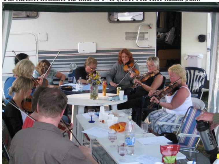
Sandvikare håller ställningarna i Bingsjö

Om skrattet kommer får man ta över ljuset och/eller lämna pant.